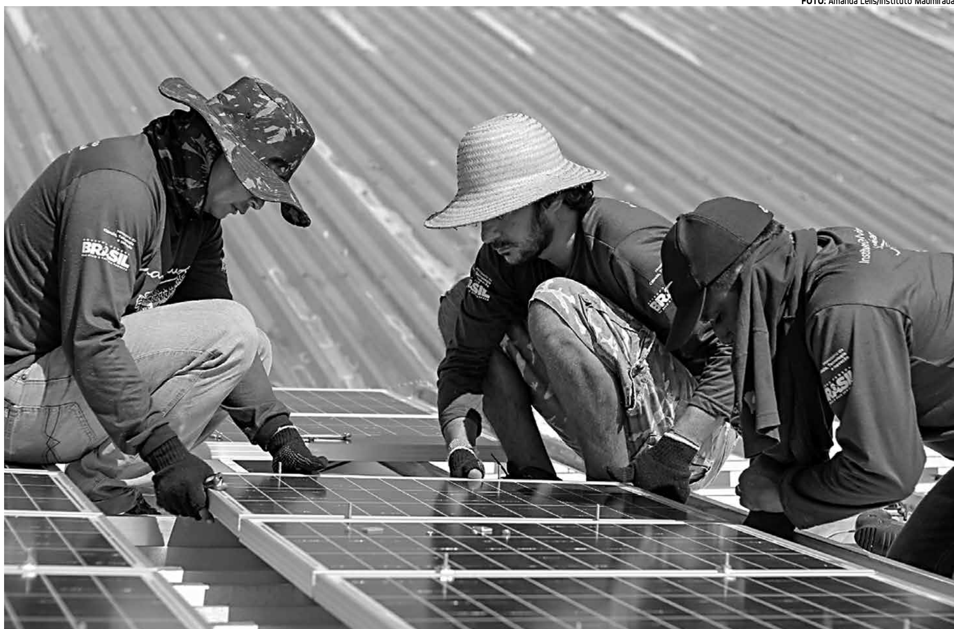
Pescadores instalam o equipamento que possui um sistema fotovoltaico que dispensa o uso de baterias e consiste em 60 painéis