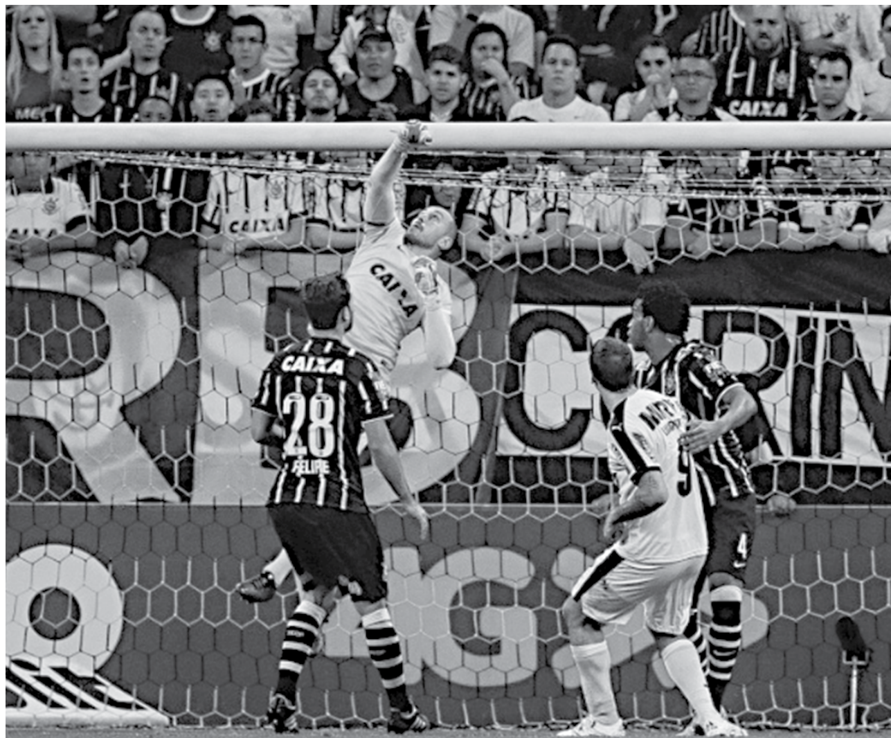
O Corinthians vem fazendo uma campanha de alto nível e recheada de vitórias. Hoje o adversário será o Fluminense

As últimas rodadas do Campeonato Brasileiro deixaram os torcedores do Coritiba mais esperançosos para o restante da competição. Depois de vencer o Palmeiras, Vasco da Gama e Chapecoense, e empatar com o Grêmio, o time coxa-branca segue vivo na luta para escapar do rebaixamento e quer mais uma vitória, hoje em casa, no Couto Pereira, diante do Sport Recife, às 22h. Nos últimos quatro jogos, o time de Ney Franco tem um aproveitamento de 83% dos pontos disputados. Embora ainda permaneça na zona da degola, na 18ª colocação, o Alverde somou 10 dos seus 22 pontos no Brasileiro nas últimas quatro rodadas. O Sport não vence um jogo há sete rodadas e essa performance tem deixado os jogadores tensos como se verificou na derrota para o Flamengo. Hoje é esperada a tão sonhada volta por cima.