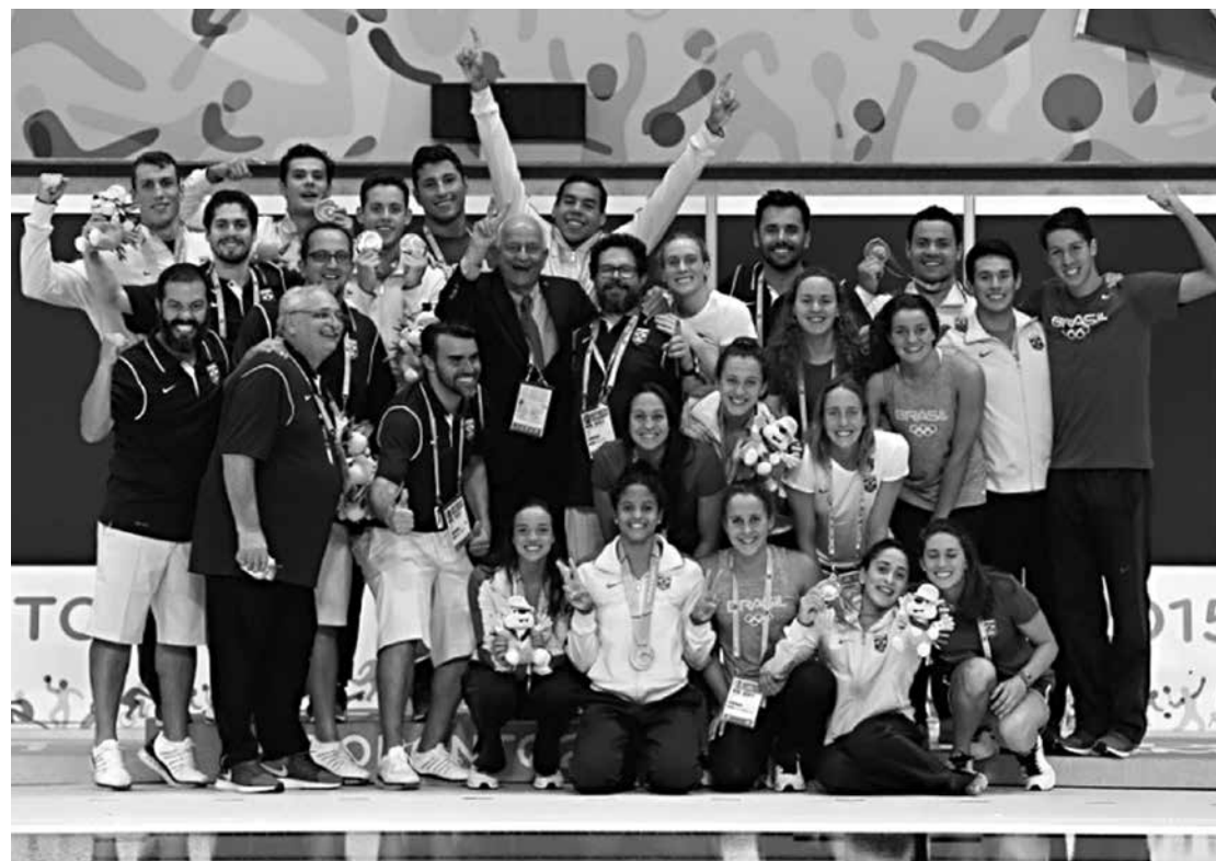
Atletas brasileiros de natação do Campeonato Mundial Júnior com integrantes da comissão técnica