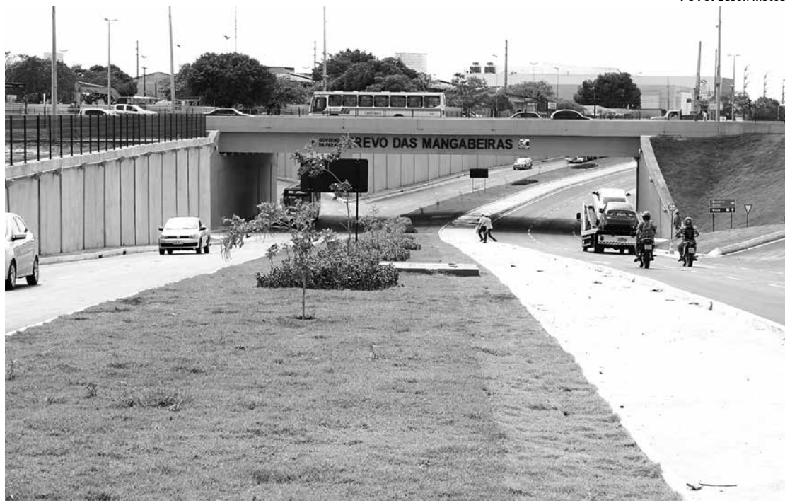
Fluxo de veículos teve a orientação de agentes de mobilidade, que garantiram a segurança na área

A Superintendência Executiva de Mobilidade Urbana de João Pessoa (Semob-JP) está monitorando, com os agentes de mobilidade, todo o entorno do Trevo das Mangabeiras desde a tarde de segunda-feira (31), quando foi inaugurado, para garantir a segurança no trânsito não apenas nos novos acessos como também nas áreas adjacentes.