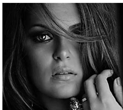
Grata revelação musical paraibana