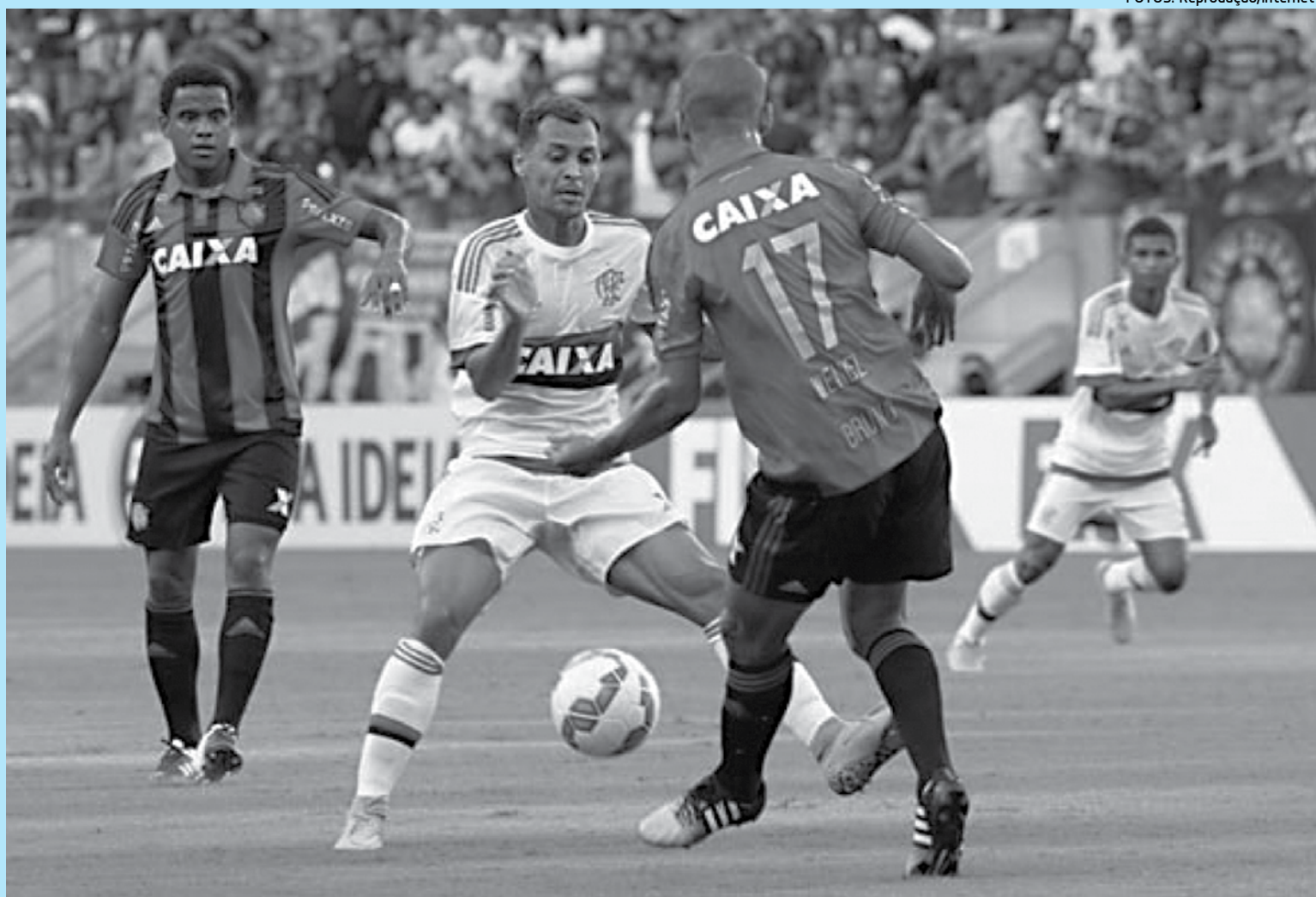
No domingo passado, o Flamengo surpreendeu o Sport Recife na Arena Pernambuco com a vitória de 1 a 0 e hoje pega o Avaí em Natal